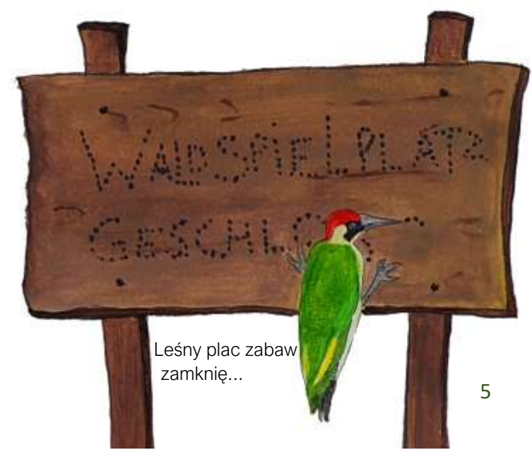
Leśny plac zabaw zamknięty...

Nawet duże zwierzęta mają ograniczyć przemieszczanie się do minimum i wychodzić z jaskini i gniazd tylko wtedy gdy szukają pożywienia lub pilnie czegoś potrzebują.